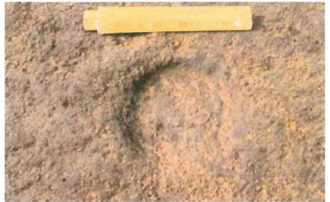
吹屋犬子塚古墳遺跡V区 蹄跡

平成 2 年、白井・吹屋遺跡群では無数の馬の蹄跡が見つかった。発見された蹄跡がそれぞれバラバラの方向を向いていることから放牧のような状態にあったことが分かった。しかも、子馬と思われる小さな蹄跡も混じっており、繁殖も行われていたと予想される。これらのことからこの地域で馬の生産が行われていたことが判明した。その後の調査で蹄跡が遺跡群の全域に分布していることが分かったため、放牧地の推定範囲は約 6 km 2 にも及ぶこととなった。かなり生産規模が大きかったと考えられる。