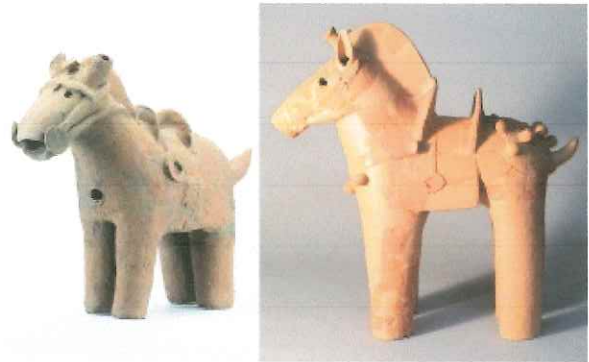
馬形埴輪 左 渋川市出土 右 伊勢崎市出土

群馬県で出土した馬型埴輪は 350 例以上といわれ、全国的に見ても非常に豊富な数量である。また、県内で見つかった動物埴輪のうち 90%を馬の埴輪が占めている。