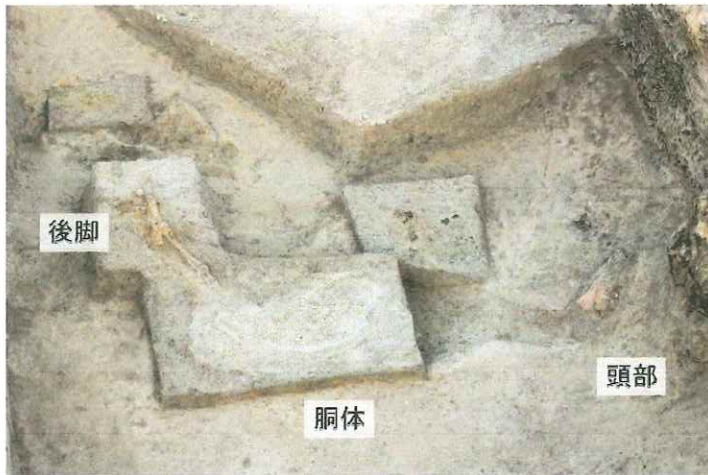
金井下新田遺跡 馬の頭骨など

平成 28 年 11 月、金井下新田遺跡から子馬の骨や古代人の歯が発見された。これは、遺跡周辺で馬の生産や飼育が行われていたことを証明する大発見となる。