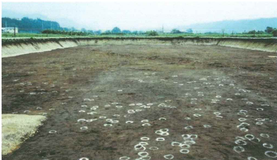
白井北中道遺跡6区 白線でマークしたものが蹄跡