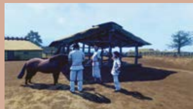
VRで再現した古墳時代の黒井峯遺跡

榛名山の噴火で被害を受けた古墳時代のムラの遺跡。噴火によって短い時間で埋もれてしまったため、当時の人々の暮らしの様子がとてもよく残っていました。