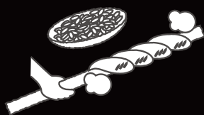
KODAI COOKING 古代料理体験