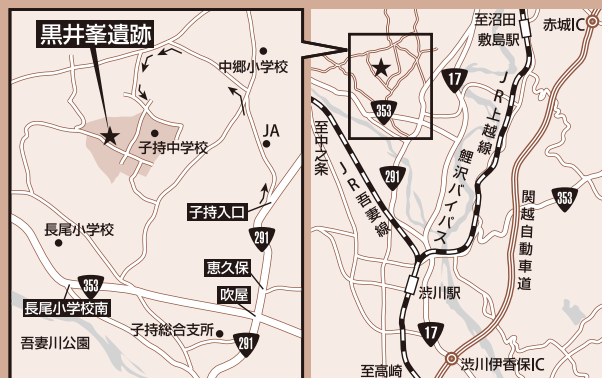
会場：黒井峯遺跡 (渋川市北牧3-42ほか)

必要事項 代表者の氏名・住所・電話番号、参加人数 (一般・中学生・小学生の内訳)