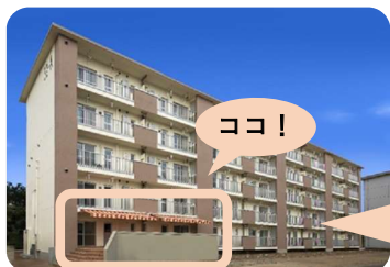
(地域開放スペースの様子)