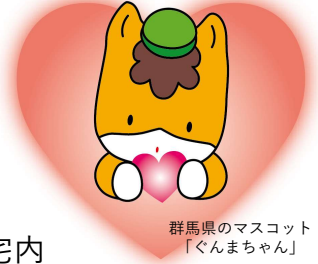
群馬県のマスコット 「ぐんまちゃん」

群馬県では、住環境の面からシングルマザーの皆さまをサポートするため、前橋市の広瀬第二県営住宅に「シングルマザー専用シェアハウス」を整備しました。現在、入居者を募集しています。