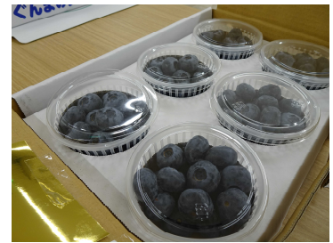
上位入賞したブルーベリー(R3年)