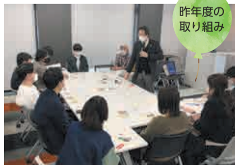
昨年度の 取り組み