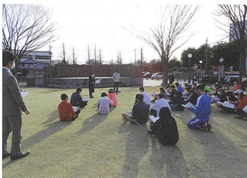
ランニングセミナーの様子