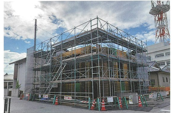
旧久米邸洋館移築工事状況

現在は、旧久米邸洋館の移築事業を行っており、基礎工事が終わり躯体工事に入り、令和5年の完成を目指しています。