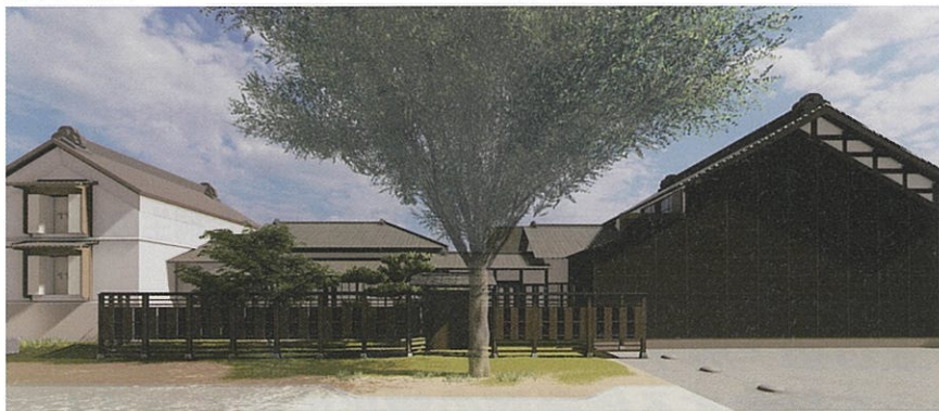
重伝建地区公開活用施設 外観イメージ

この施設は重伝建地区の核として、この地区で活動するひとや、重伝建地区を訪れるひとに対して、情報を発信する場として、様々な活動の拠点となる施設を目指し整備予定です。