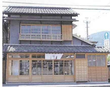
活用例: Com+position(コンポジション) 帽子の製造販売

重伝建地区公開活用施設と並行し、群馬県の事業として本町通りの整備も行われています。重伝建地区のこれから数年の変化が新たなまちなみ保存の機運へつながらよう、今後も継続して歴史まちづくりに取り組んでまいります。