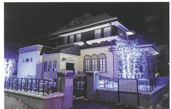
旧土岐家住宅洋館イルミネーション

また、プロモーション活動強化のため、プロのイラストや、シンボルマークを作成し、活用するとともに、YouTubeでのプロモーションも試み、旧土岐家住宅洋館の360°動画を制作しました。