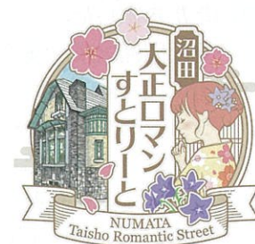
旧久米邸洋館イラストを活用したシンボルマーク