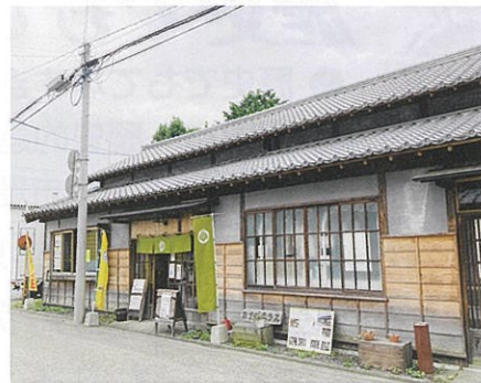
活用例: カイバテラス カフェ兼書籍・雑貨店