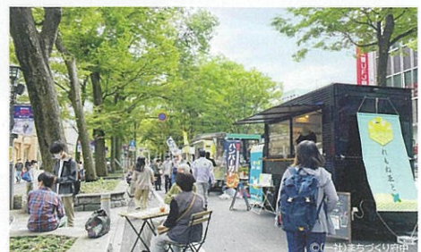
府中駅から大國魂神社につながる「馬場大門けやしき並木」では府中ストリートテラスが開催され、賑わいが生まれています。