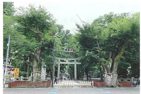
中心にある大國魂神社はまちの宝。歴史と伝統を感じる清浄の空間です。