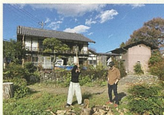
「ほしのいえ」でのまきわり