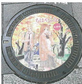
ちはやぶるのマンホール。アニメの聖地として若者を惹き付けています。