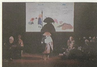
【Art for Futuer】の様子

まちづくりイベントで大切にしていることは、「自分が心から『良い』と思うことをやる」という点です。ここでの『良い』は、環境に良いとか、子供にとってプラスとか、自分の好きなこと、楽しいこと、という『良い』です。更に地域社会にとってもプラスになるのであれば、楽しくできそうです。