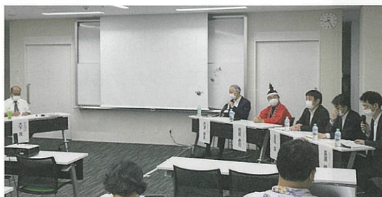
観光フォーラムのパネルディスカッション—くらやみ祭の衣装での出演……地域愛を感じました!!