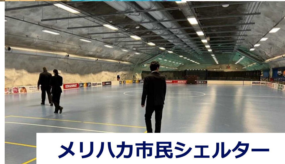
メリハカ市民シェルター