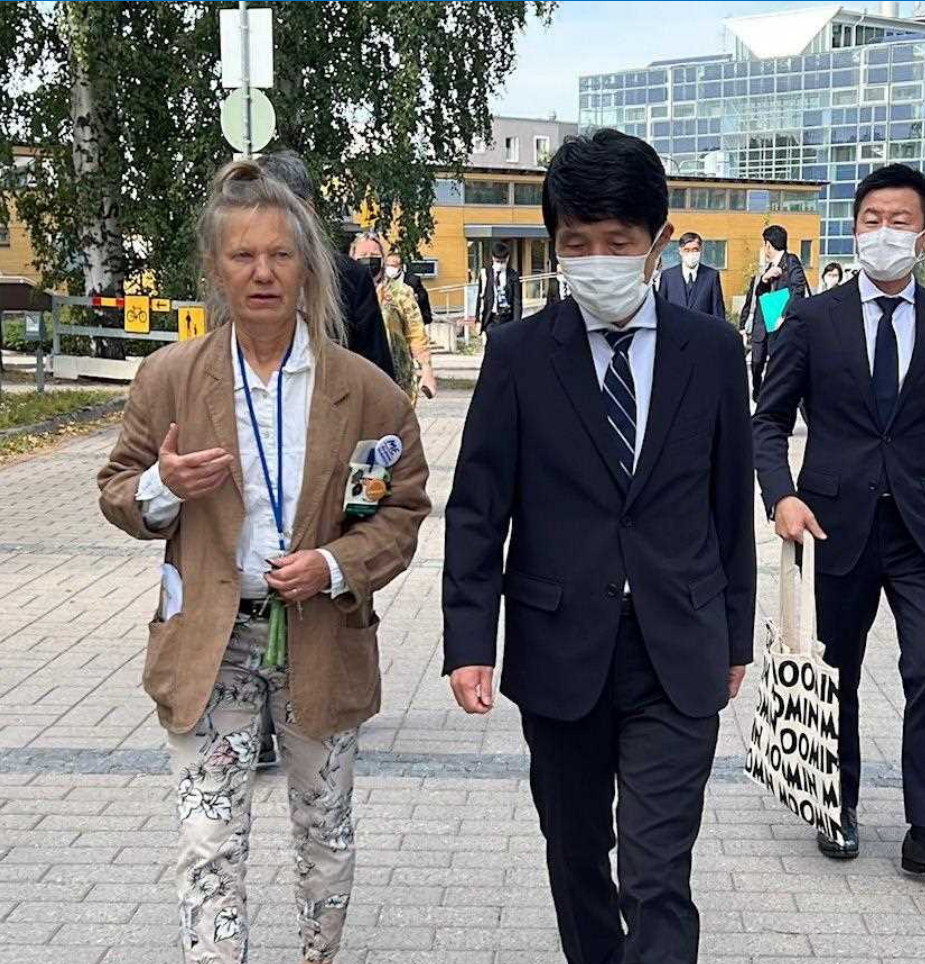
ヘルシンキ大学獣医訓練病院