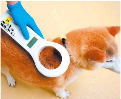
マイクロチップを読み取る様子