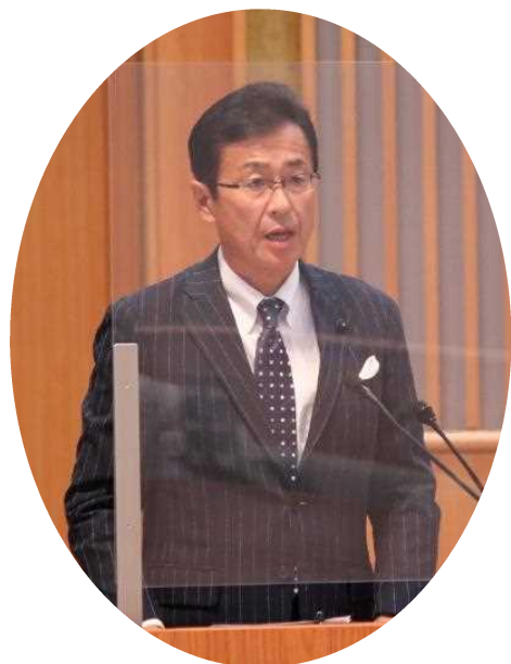
自由民主党 大和 勲 議員