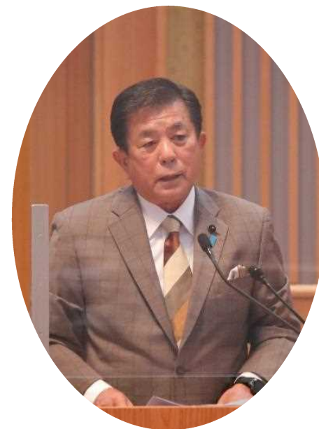
自由民主党 伊藤 清 議員