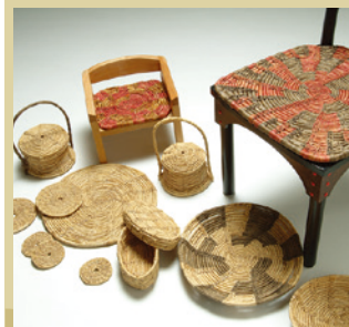
西上州竹皮編 [展示・販売・実演] 《高崎市》