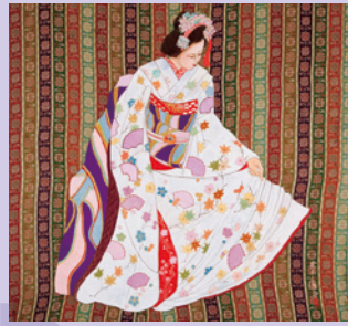
桐生横振刺繍 [展示] 《桐生市》