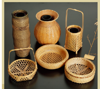
北橘竹工芸 [展示・販売] 《渋川市》