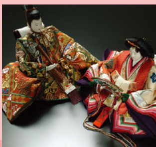
前橋びな [展示] 《前橋市》