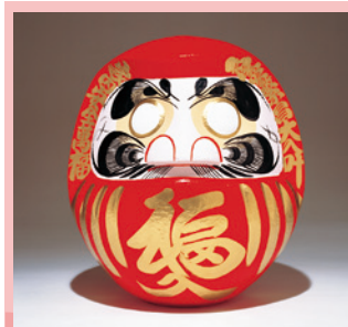
高崎だるま [展示・販売・実演] 《高崎市》