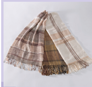
絹がら紡紬桐生和布 [展示・販売] 《桐生市》