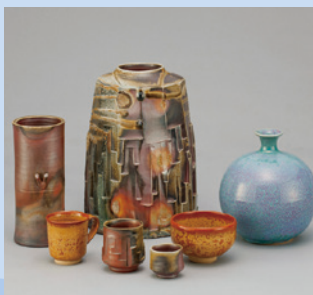
自性寺焼 [展示・販売] 《安中市》