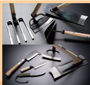
安中鍛造農具 [展示・販売] 《安中市》