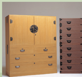
月夜野桐箆筒 [展示・販売] 《みなかみ町》