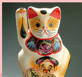
高崎まねき猫 [展示・販売] 《高崎市》