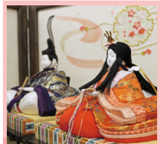
榛名の木目込 [展示・販売・実演] 《高崎市》