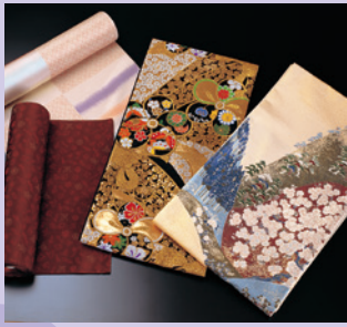
桐生織 [展示・販売] 《桐生市》