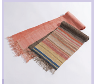
上州富岡手紡ぎ真綿絹織 [展示・販売] 《富岡市》