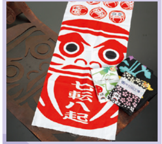
上州高崎注染手ぬぐい [展示・販売・実演] 《高崎市》