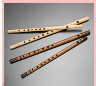
甘楽篠笛 [展示・販売] 《甘楽町》