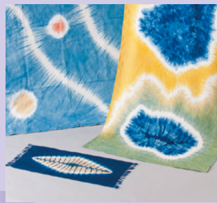
藍・草木を使った桐生絞り染め [展示・販売] 《桐生市》