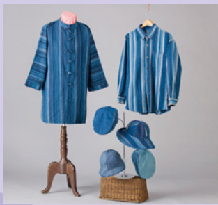
正藍染上州小倉織 [展示・販売] 《桐生市》