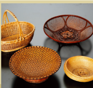
山中上山竹工芸 [展示・販売・実演] 《上野村》