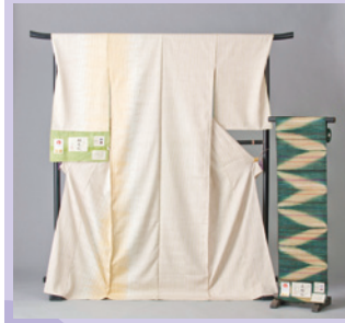
桐生絞 [展示・販売] 《桐生市》